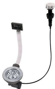
Piletta automatica 8407 100