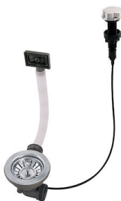
Piletta automatica 8407 000