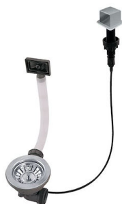
Piletta automatica LIRA 8407 103